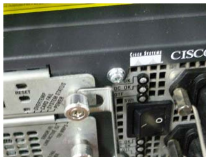
左:ツメを引っかけて 使用します