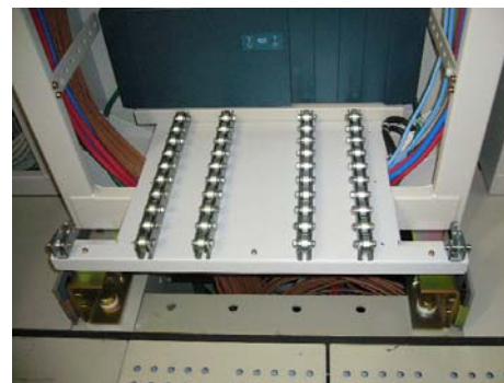
「スライドアダプター」(GSR用)