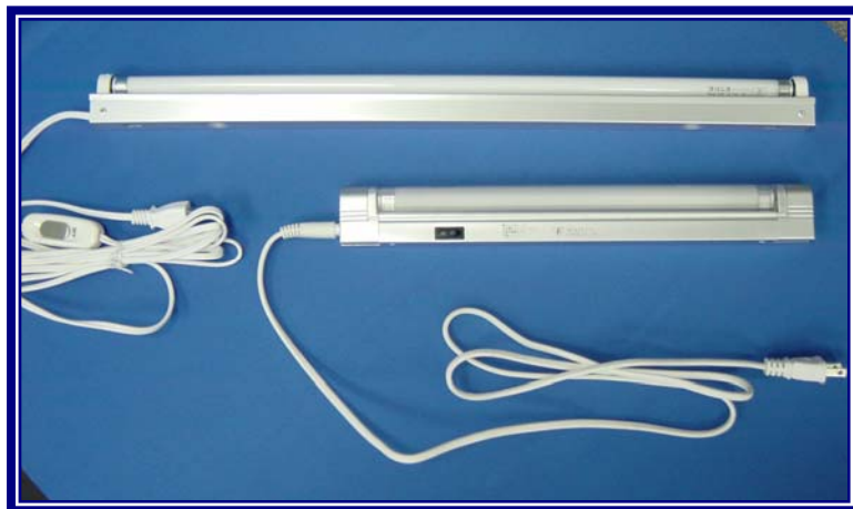
上:IDM架棚照明「タイプJP-L」