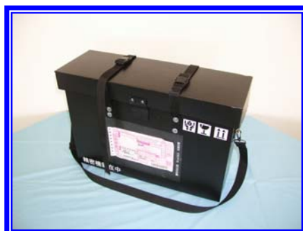
ショルダーベルト使用時