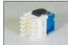
Cat.5e RJ45 モジュラー ジャック (KRONE 端子)