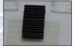
スリーブホルダー