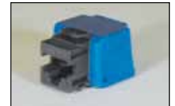
Cat.6 RJ45 モジュラー ジャック (KRONE 端子)