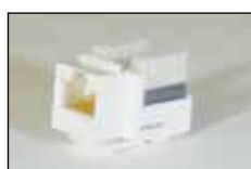
Cat.5e RJ45 モジュラー ジャック (110 端子)