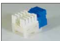
Cat.5e RJ45 モジュラー ジャック (KRONE 端子)