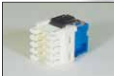
Cat.5e RJ45 モジュラー ジャック (KRONE 端子)